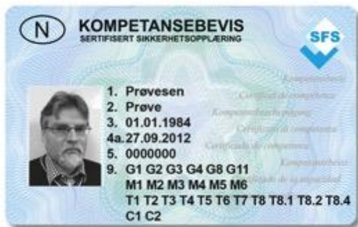
Bild 4. Kompetensbevis för massaförflyttningsmaskiner och kranar (22)

Förkunskaper för dessa certifieringar är de samma som för massaförflyttningsmaskiner - Modul 1.1, samt ett kompetensbevis –G11- Lyftredskap.