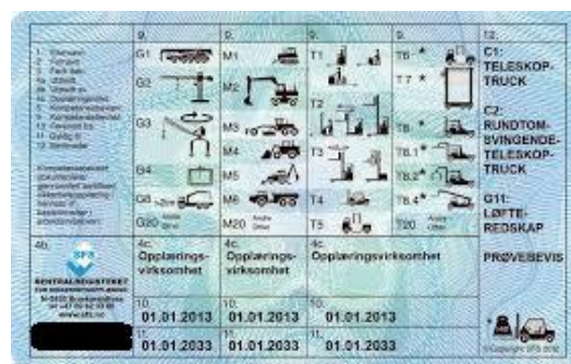
Bild 3. Kompetensbevis for massaflyttningsmaskiner og kranar, kortets baksida. (22)

Utbildningen avslutas med praktiskt prov i de olika maskinerna. (20) (21) (16)